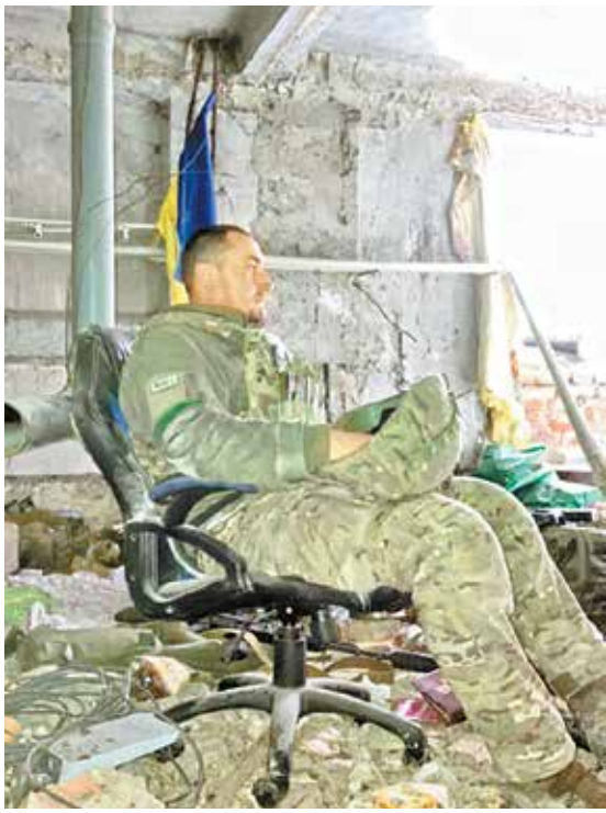
«Сафарі» зі Сміли – в одному з «офісів» Фортеці Бахмут, весна-2023