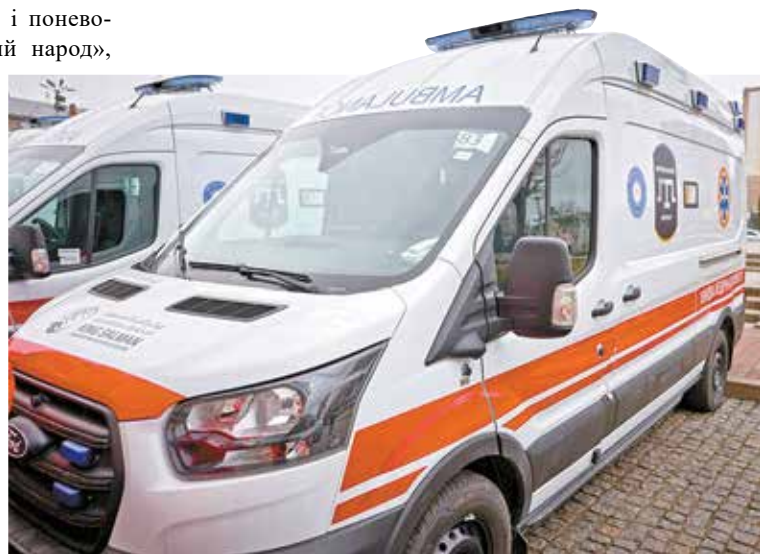
Нові реаніобілі — надійні американські Ford-и.

«Дякую славній команді «Кримського Фронту» та всім благодійникам, завдяки яким стала можливою суттєва підтримка бригад медицини катастроф Черкаської області, які першими прибувають на найважчі та найкритичніші для життя людей виклики, у тому чис-