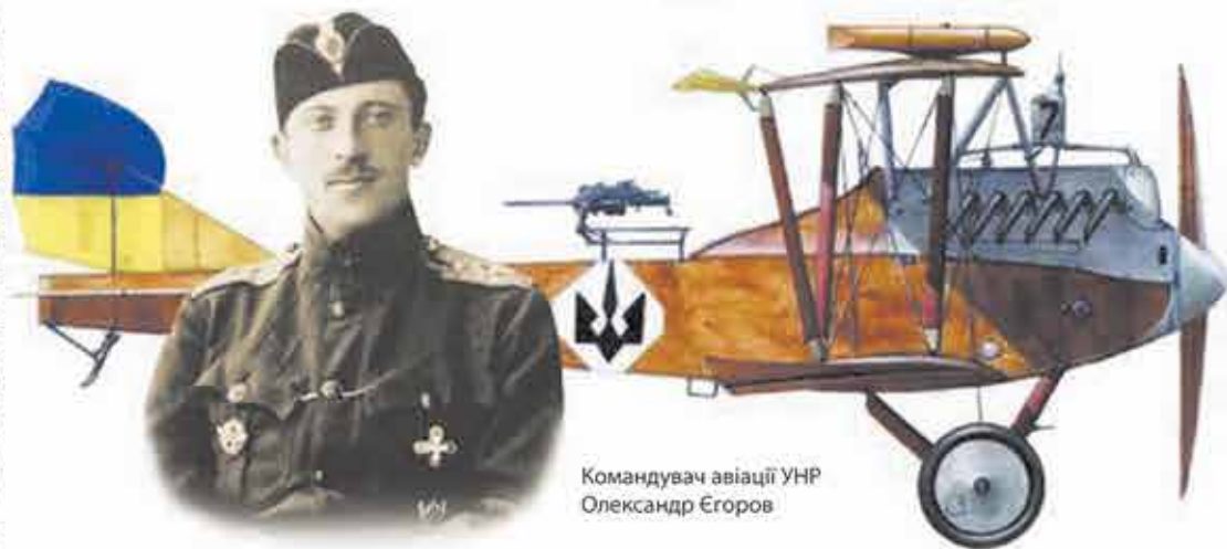
Командувач авіації УНР Олександр Єгоров