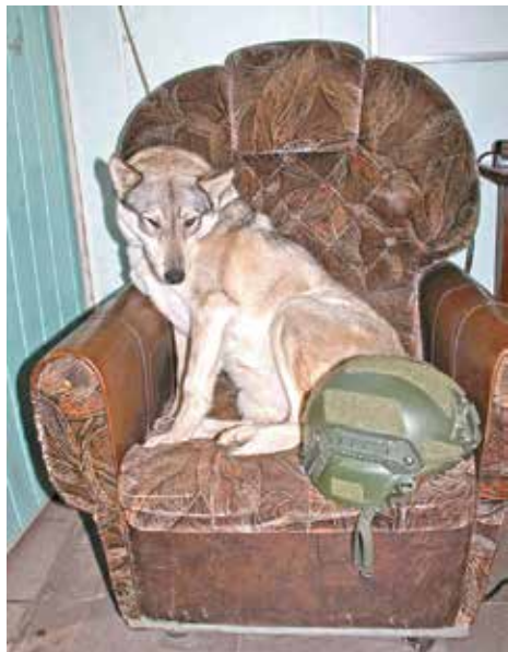
Її позивний - «Блонда». Вона любить своїх і ненавидить тих, через кого лунають повітряні тривоги...