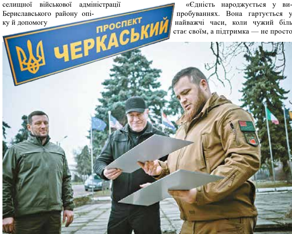
У Нововоронцовці таблички «Прспект Черкаський» з'явилися понад дорогою, якою доставлялися перші гуманітарні вантажі з Черкащини

Візит завершився обговоренням подальшої співпраці та реалізації спільних проєктів у освітній, молодіжній і культурній сферах діяльності.