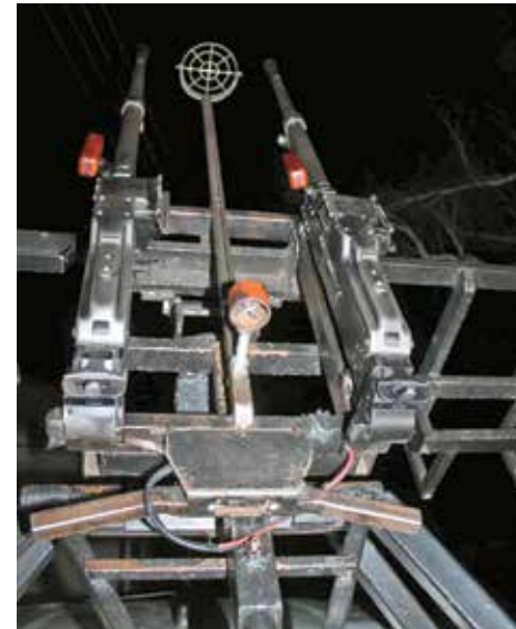
Нічне небо - під прицілом.

З бійцями однієї із мобільних груп ДФТГ знайомимося перед їхнім заступанням на