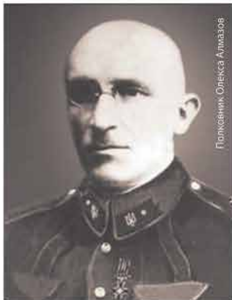
Полковник Олекса Алмазов

Олекса Алмазов був з родини добропорядного, нічим не примітного херсонського чиновника. Олекса виявився здібним у навчанні – і в час навчання у реальному училищі грузинського Тифлісу (Тбілісі), і у військових училищах – спочатку піхотному