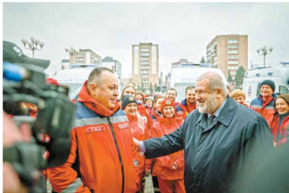
«Кримський фронт» і Черкащина посилюють співпрацю. Мета спільна - повернення Криму додому, в Україну

лі, після ворожих атак по населених пунктах Черкаської області.