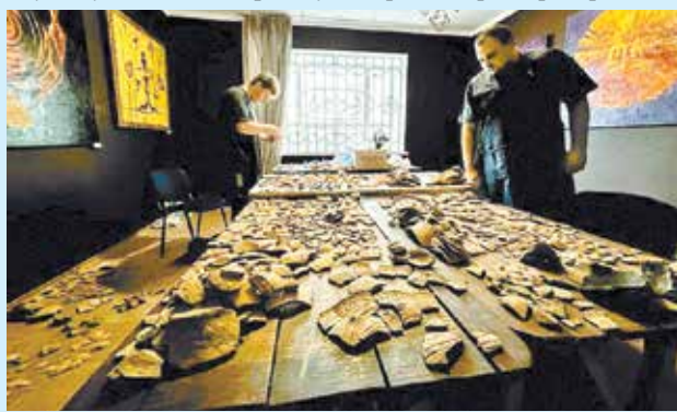
Фото «пазлів» з кераміки часів Трипільської культури опублікував на своїй фейсбук-сторінці директор Державно-