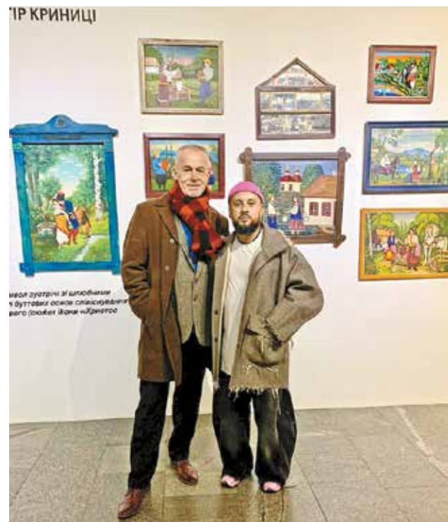
бездонним джерелом натхнення, душевного тепла і національної гордості», - наголошує митець з Черкащини.

Українське мистецтво різне і не потребує поділу на сорти та ступені якості. І ця різноманітність робить його