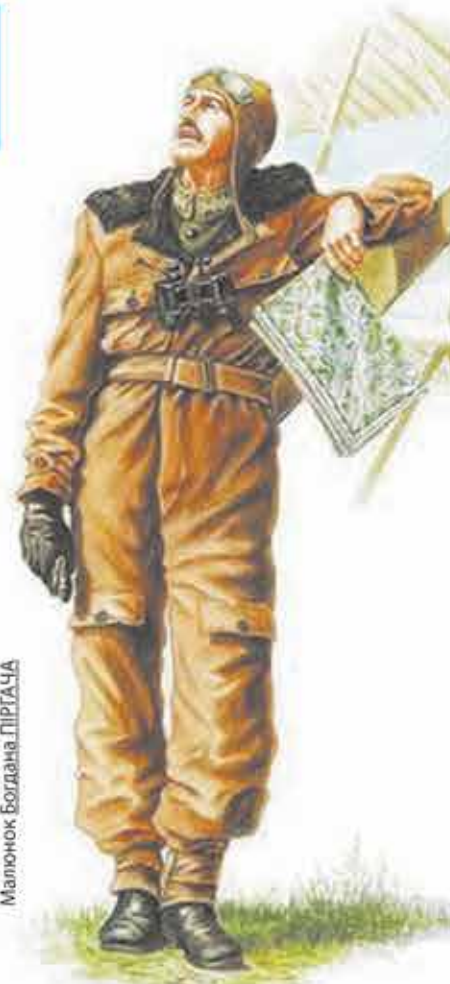
Малюнок Богдана ПІРГАЧА

Частина бійців брала участь і в Другому зимовому поході і навіть коли «алмазівці» вже були інтерновані до Польщі, під час