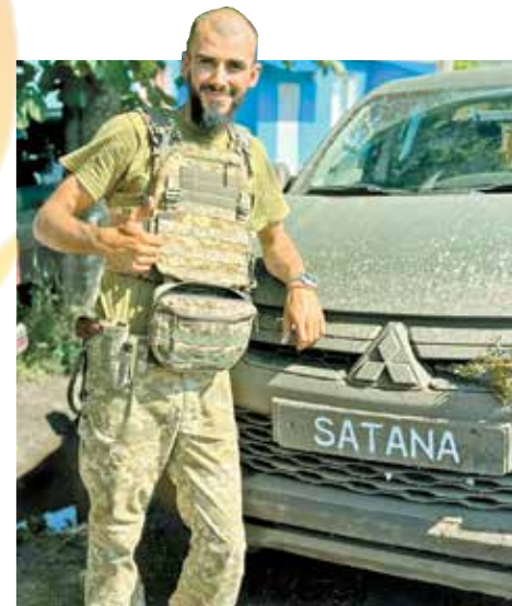
Солдата з Умані назвали «Маджиком» за відчайдушність і зовнішність, яка нагадувала афганського моджахеда, а його японського позашляховика – «Сатаною», за здатність уціліти серед суцільного пекла. Метал авто таки згорів, та воїн не зламався...

У «Маджика» – часткова ампутація обох ніг, серйозні ушкодження спини і опіки третини тіла, та зараз він сповнений оптимізму, впевнено (хоч і з вимовою з проблемами від контузії) говорить про перспективи і з теплом згадує братів по зброї, які продовжують воювати.