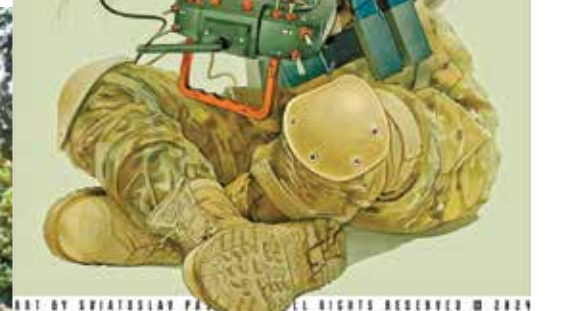
«Романтику» повітряних ударів по ворогу «Блогер» пропонує відсунути подалі від Черкас – і бити агресора таки на його території... Малюнок Святослава Пацука, скріншот з відеоблога Валентина Чернявського.