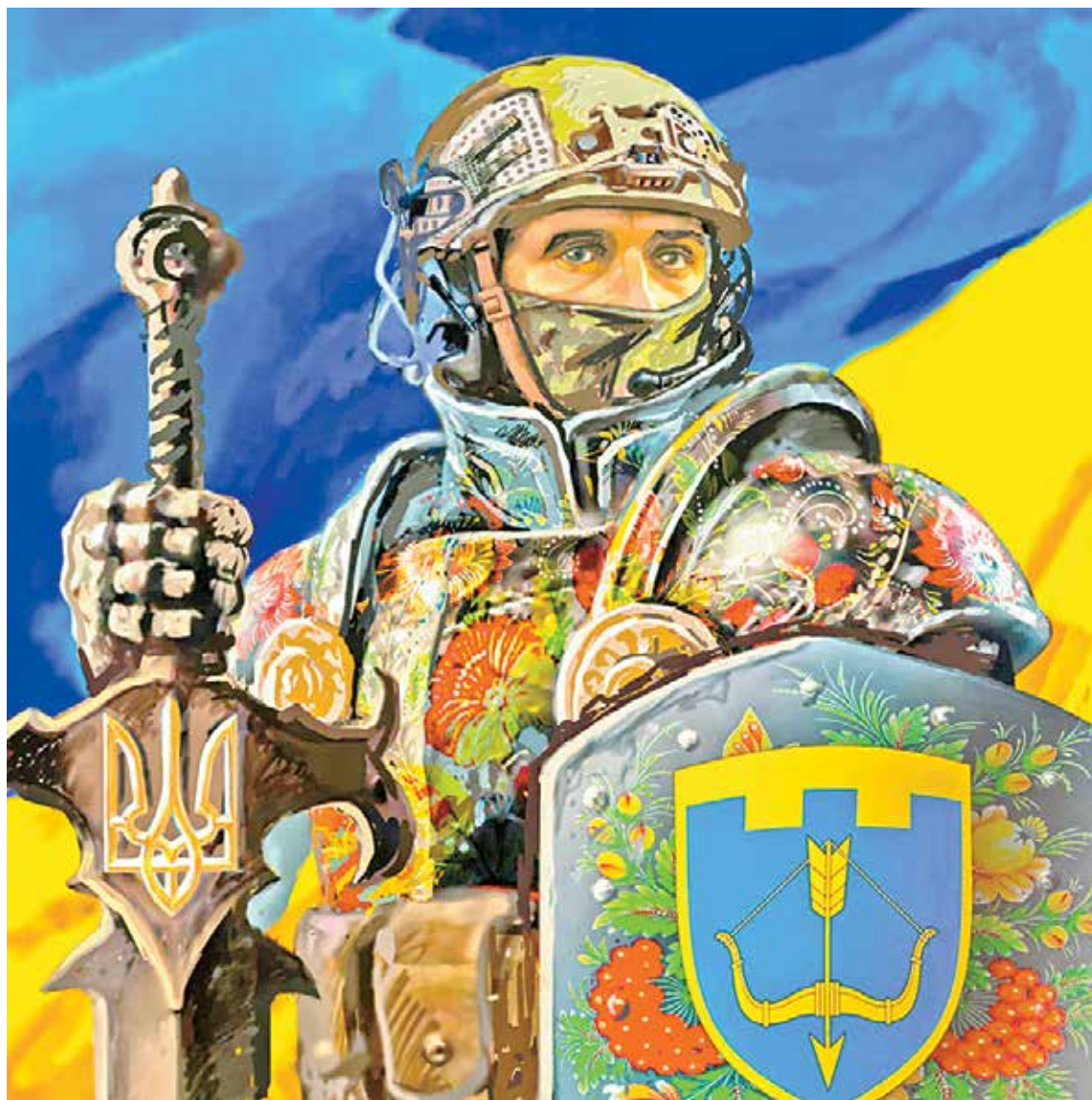
Бійці Черкаської окремої бригади тероборони продовжують місію лицарів минулого – боротьбу за Волю Нації і Українську Державність...

Присвоєння Черкаській бригаді почесного найменування імені отамана Лютого-Лютенка сприятиме національно – патріотичному налаштуванню, усвідомленню наскрізності та тяглість героїства українського народу у боротьбі за волю та власну державу. Ототожнення себе з лицарем духу, успішним військовим, який заслужив славу та повагу як у себе на батьківщині, так і серед широкого загалу українців за кордоном – отамана Лютого-Лютенка, додасть кожному з військовослужбовців бригади наснаги та жаги до звершень у захисті країни.