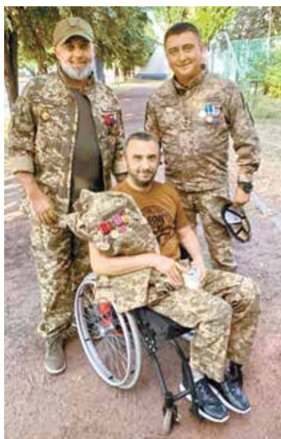
«Соліст» не втрачає оптимізму попри надважкі поранення

До «великої» війни працював в агро-секторі і був визнаним фахівцем по закордонній агротехніці. Зрештою, розвідником став теж чудовим. Між різким світлом фар першої російської колони,