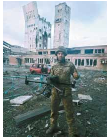
Спортсмен і тренер «в миру» – став воїном і командиром у часі війни...

Звалило з ніг важке поранення під Вугледаром, після якого лікарі сумнівалися, чи зможе він взагалі ходити. Та через два місяці лікарень він повернувся в стрій, а незадовго після того, як заледве 200 метрів в день проходив міг – знову побачив бігати 5-кілометровий крос. Металеві пластини, якими лікарі замінили частину