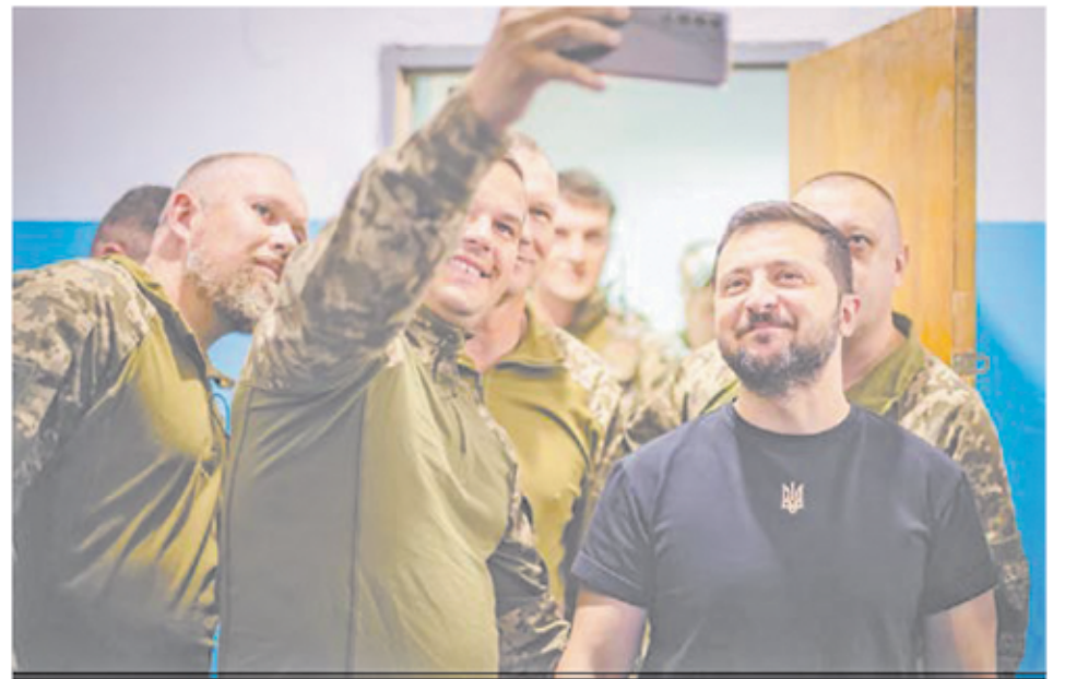
Спільне селфі Володимира Зеленського з бійцями бригади імені Володимира Мономаха