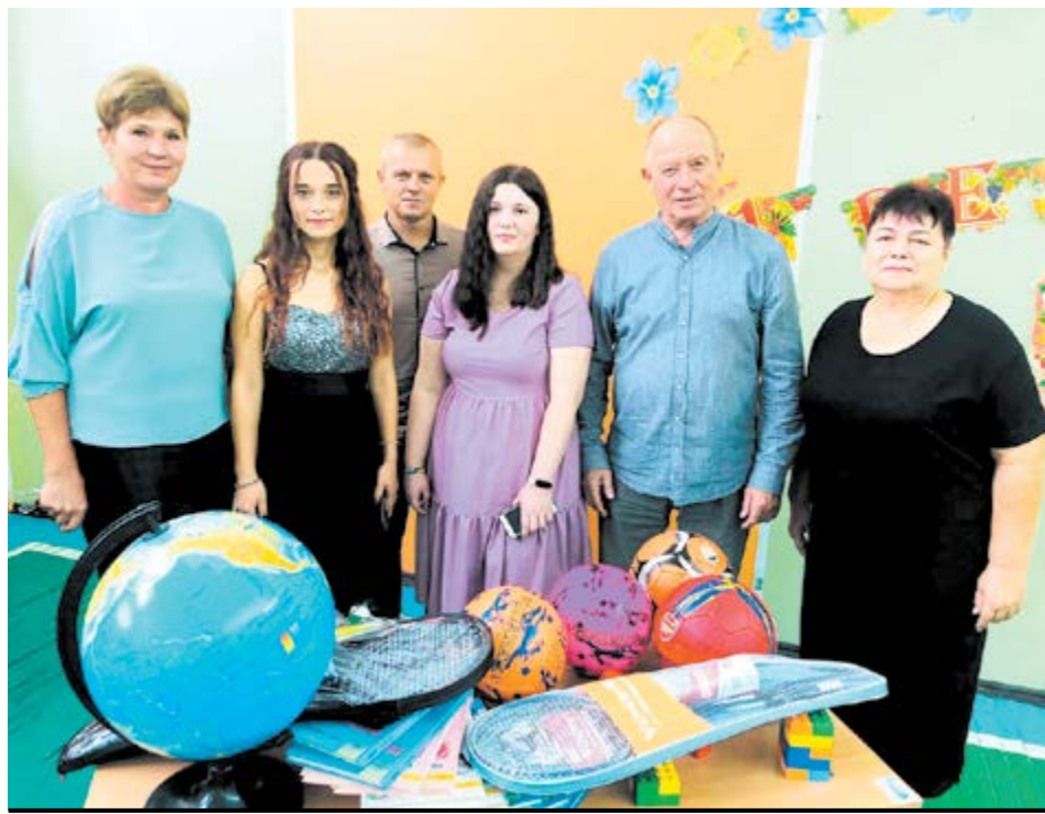
Спортивний інвентар і книги – подарунок вчителям, які виховують нове покоління здорової та освіченої української нації

знань і можливостей, які він отримусь ще за шкільною партою», - говорить Володимир Барвет.