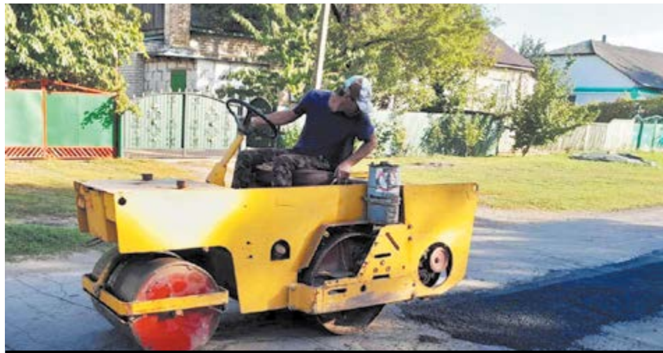
«Відрихтовані» дороги – запорука комфорту поїздок пасажирських автобусів, карет «швидкої допомоги» та іншого транспорту