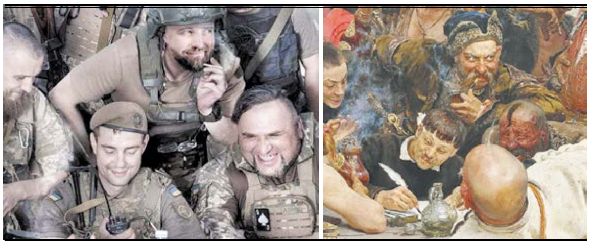
На осучасненій французьким фотографом картині у ролі кошового отамана – золотонісць з сигаретою замість люльки, а «писар», якому він надиктовує нахабно-веселі слова, адресовані ворогу – вже не з пером і чорнилами, а з рацією, як це було на острові Зміїному...

До речі, мало хто знає, що знаменитий «Лист запорозьких козаків турецькому султанові», сюжет якого Рєпін використав для найзнаменитішої своєї картини - в українських, російських і німецьких джерелах XVII століття спочатку називався «Листом ЧИГИРИНСЬКИХ козаків» - і тільки століттям пізніше замість чигиринців авторство листа почали приписувати запорожцям. До речі, сам Рєпін згадував про те, що частину колоритних типажів для прообразу персонажів цієї картини він знайшов на ярмарку саме в Чигирині - це були місцеві косари,