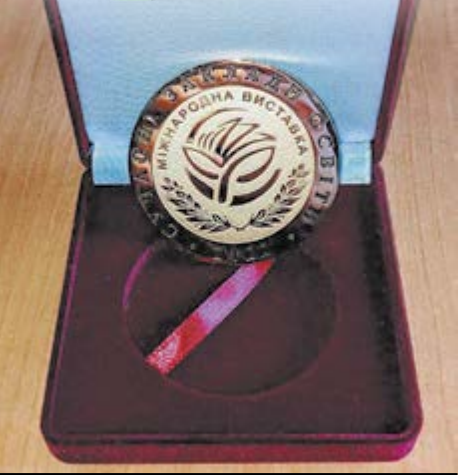
Золоту медаль Міжнародного конкурсу освітяни з Крупського отримали після презентації напрацювань на тему «Виховання національної еліти – запорука майбутнього розвитку українського суспільства»

У школі села Крупського на Золотоніщині початкову освіту здобувають 48 учнів. Цього року педагогічний колектив було відзначено золотою медаллю за представлені освітянські праці на чотирнадцятій міжнародній виставці «Сучасні заклади освіти – 2023» (World Edu-2023), яка проходила за підтримки Міністерства освіти і науки, Національної академії педагогічних наук України та Державної наукової установи «Інститут модернізації змісту освіти».