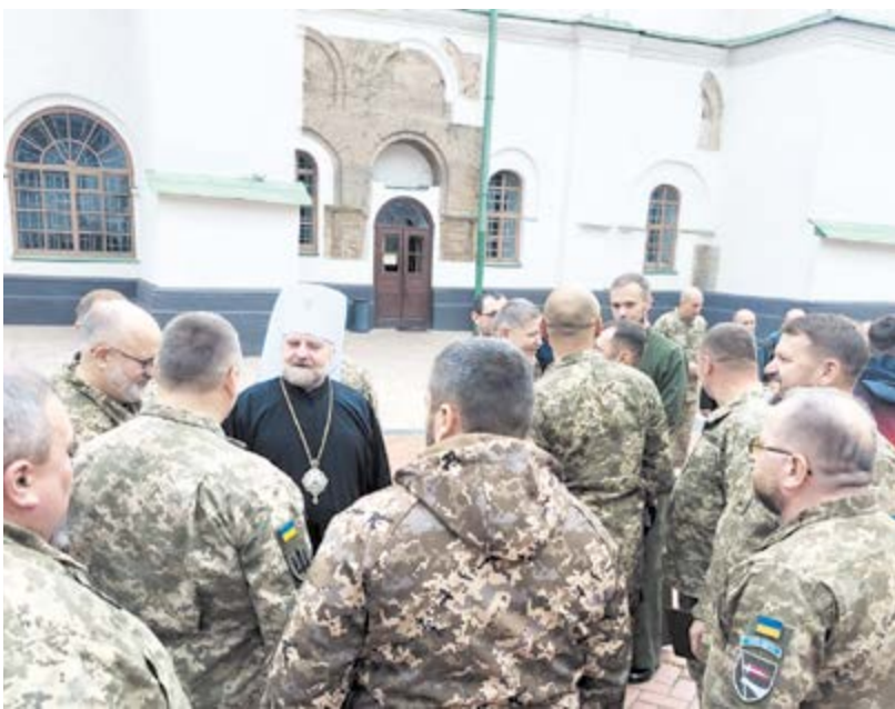
Від ПЦУ випускників капеланських курсів у стінах Софії Київської вітає митрополит Черкаський і Чигиринський Іоан, як очільник Синодального управління військового капеланства ПЦУ

Днями у Черкасах пройшов «Вишкіл капеланів». Організували навчання для священників усіх підрозділів 118-ї бригади капелани управління разом із Синодальним управлінням військового духовенства ПЦУ.