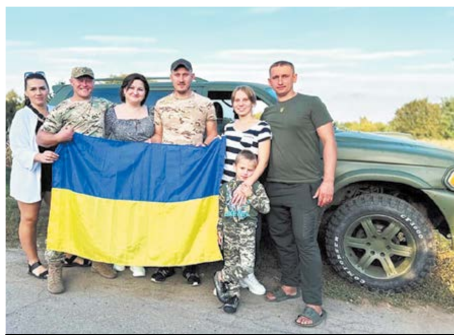
«Велика машина дядькам-артилеристам» від 5-річного хлопчика з Черкащини і його інтернет-підписників