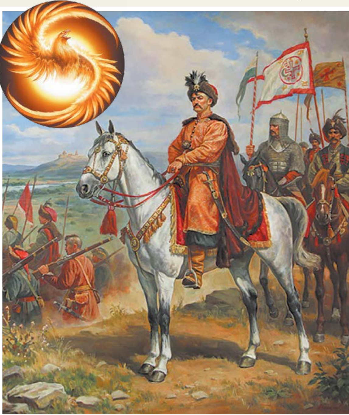
Таємне товариство апелювало до слави гетьмана Хмельницького і його «столичного» Чигириня, з яким вважали за честь дружити більшість країн тогочасної Європи...