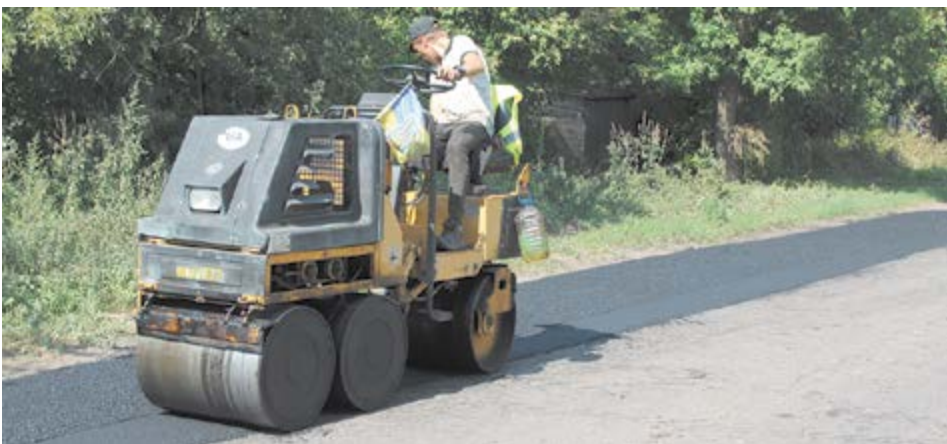
Де між селами попрацювали люди з лопатами і каток з синьо-жовтим прапорцем – там тепер простіше їздити автобусам, спецтранспорті і автівам місцевих мешканців...

Серед найбільш гострих питань у більшості сільських громад залишається питання ремонту та утримання доріг.