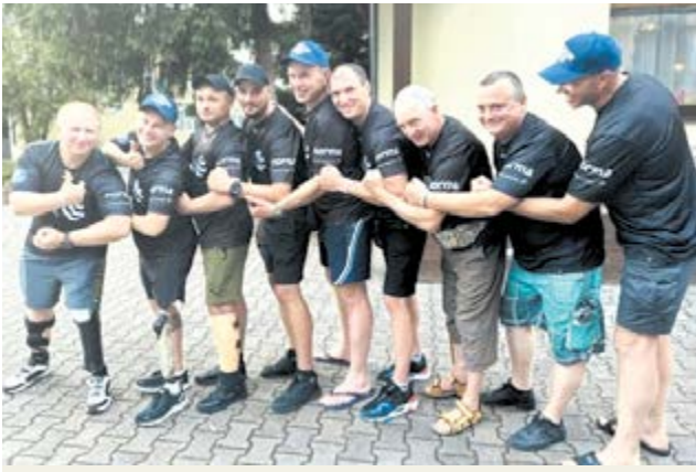
Українські ветерани переконані: після відпочинку на Балтійському морі у друзів скоро будуть і курорти українського Криму і Азовського узбережжя...

Нині українська і польська сторони працюють над продовженням цієї програми на умовах співфінансування, пояснює упов-