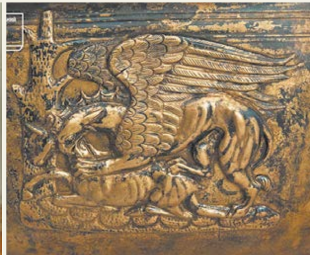
Піщанський скарб і його бронзові фрагменти: міфічна сирена, яка губила мореплавців (чи й не цей човен?..) і грифон, який терзас здобич