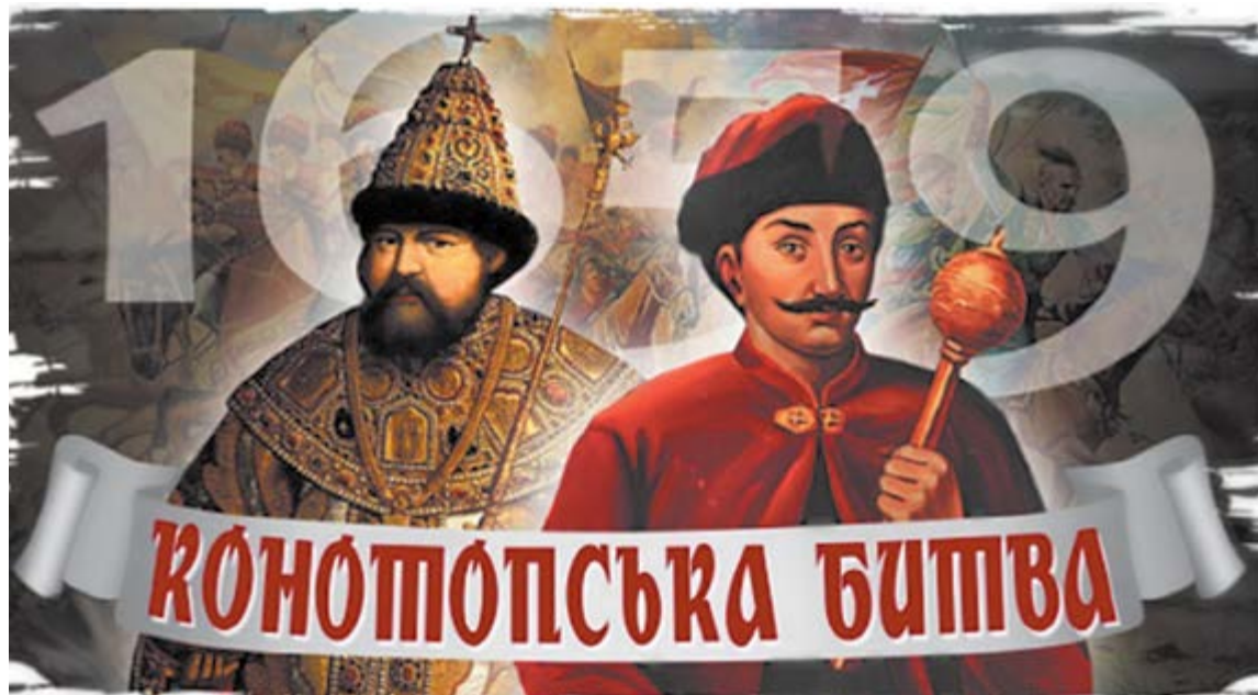
Очільники українського і російського народів у 1659 році: одутий Алексей Романов і вусатий Іван Виговський «смутно» нагадують когось із наших сучасників...