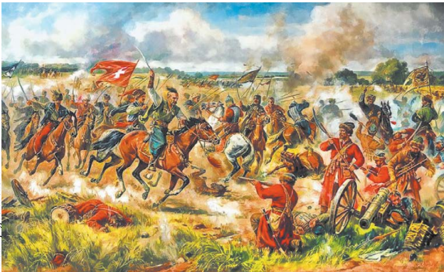
Малюнок Артура Орльонова

Бої загонів Гуляницького проти росіян були абсолютно успішними: він відбив у московитів Лубни, Гадяч, а потім і Конотоп. Після цього, з квітня до початку липня, цілих 70 днів, 4 тисячі його козаків утримували Конотоп, відбиваючи численні атаки 150-тисячного війська Трубецького, що оточило місто. На пропозицію зрадити гетьману й Україні, Гуляницький гнівно відповів, що росіяни в Україні «многі міста випалили і висікли, краще бути у турка, аніж у московитів...» І додав, що повірять у «мирні» наміри Москви тільки