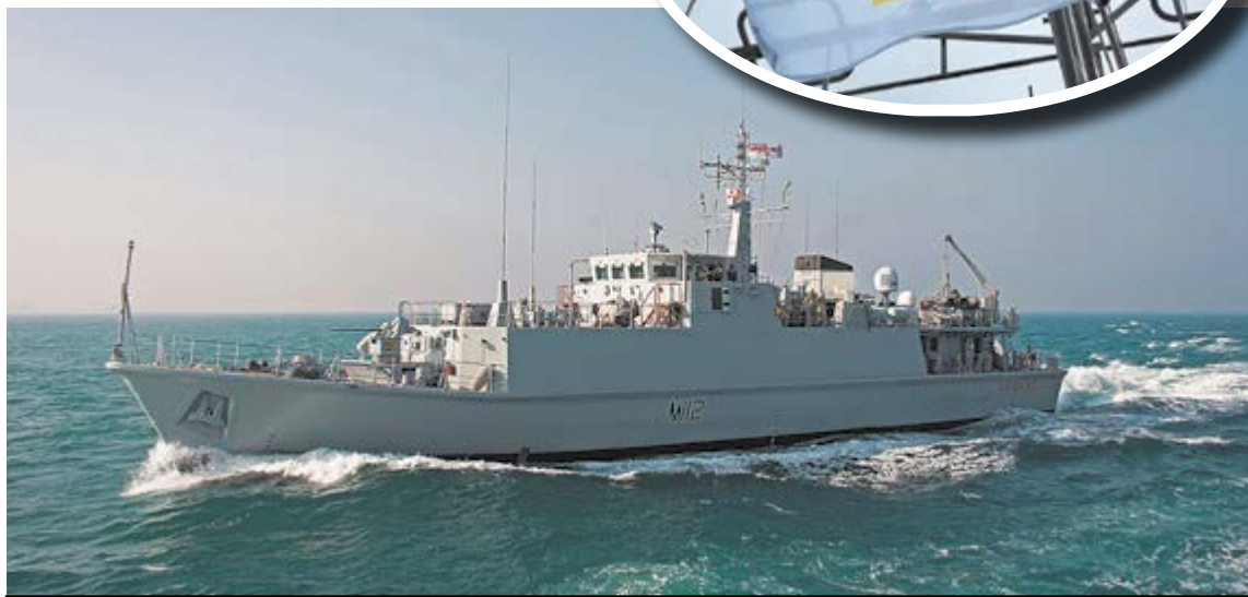
Британський ветеран переможної війни у Перській затоці HMS Shoreham тепер носить ім'я «Черкаси» і після перемоги України знешкодуюватиме міни у загадженому російськими окупантами Чорному морі...