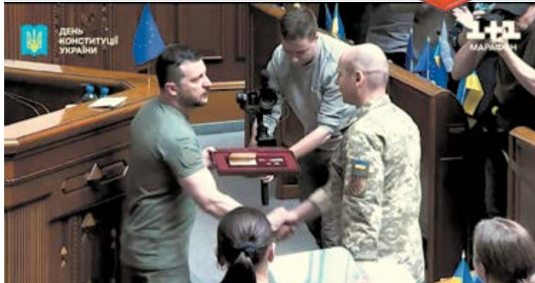
Президент Володимир Зеленський вручив Зірку Героя командирі 96-ї зенітної ракетної бригади Повітряного командування «Центр», полковнику Сергію Яременку.

Про це повідомляють Повітряні сили ЗСУ. Зазначається, що після повномасштабного вторгнення уродженець Умані Сергій Яременко очолює бригаду, яка відбиває повітряні атаки Росії у центральних та північних регіонах України.