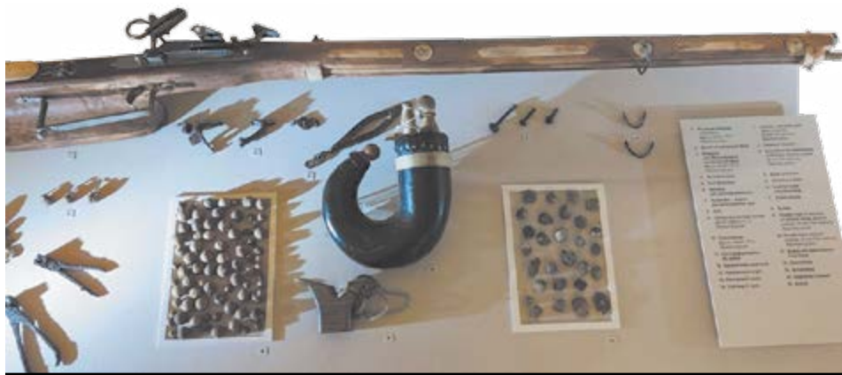
Мушкет та інші знахідки, зроблені археологами на місці Кумейківської битви

На Черкащині триває боротьба за збереження історичної спадщини