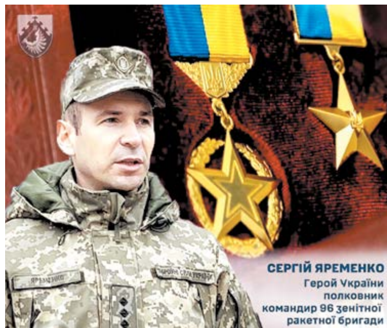
СЕРГІЙ ЯРЕМЕНКО Герой України полковник командир 96 зенітної ракетної бригади