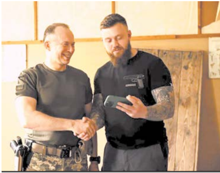
Комбат 2-го штурмового батальйону «Сліп» робить селфі з Командувачем сухопутних військ Олександром Сирським.

В одному з червневих відеозвернень підрозділ відзначив і Президент України: «Окремо хочу відзначити сьогодні наших героїв на Бахмутському напрямку... Молодці, воїни! Третя окрема штурмова бригада та 57-ма