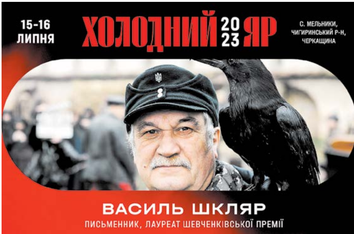
ВАСИЛЬ ШКЛЯР ПИСЬМЕННИК, ЛАУРЕАТ ШЕВЧЕНКІВСЬКОЇ ПРЕМІЇ

2022 рік став роком великої втрати для родини фестивалю.