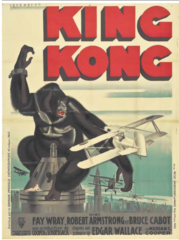
Афіша фільму «Кінг Конг» 1933 року

Тож замість розстрілу потрапив до тaborу для військовополонених – «як оболванений буржуазний пролетарій», декілька місяців разом з іншими полоненими будували залізницю під Москвою... Втік з полону з другої спроби, через Литву добрався до Варшави і в травні 1921 року отримав з рук Юзефа Пілсудського найвищу нагороду Польщі – орден Віртутті Мілітарі.