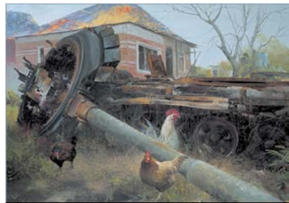
Весна-2023: українська природа оживає на фоні мертвого російського танка...

Народжений в Умані на Черкащині, колишній авіаінженер, який став митцем, вже давно жив у Харкові, поки вранці 24 лютого 2022 року російські снаряди й ракети не обірвали мирну ідилію художника, який досі малював практично виключно полотна, присвячені сільським пейзажам, краєвидам природи і мирним людям. Від прямих попадань снарядів «склався» гараж і він розчавив бетонними плитами улюблений позашляховик митця, з якого той завжди «пилінки здмухував». Певний