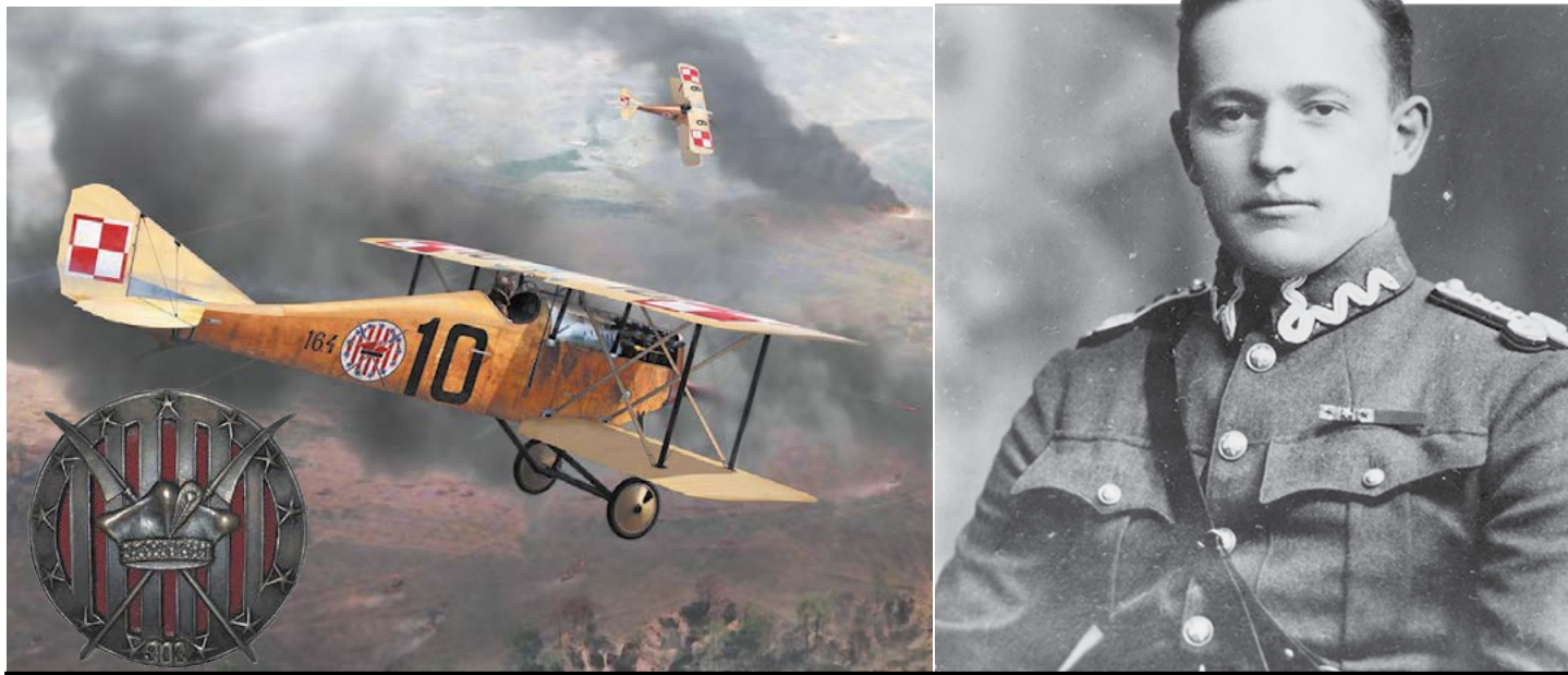
Меріан Купер в мундирі польського пілота та його ескадрилья імені Костюшка у бою