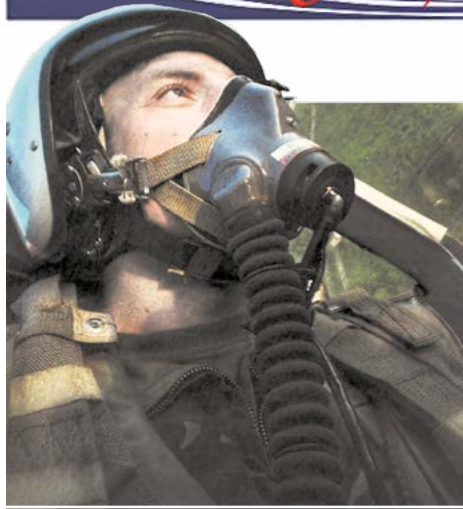
Євген Лисенко в кабіні свого винищувача (прижиттєве фото)

Поштову марку, присвячену Євгену Лисенку родом зі смілянської Ротмистрівки, який загинув рік тому, навесні 2022-го, розробили у далекій Центральноафриканській Республіці.