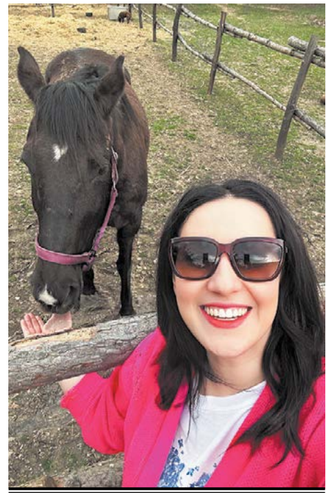
Соломія і Соля