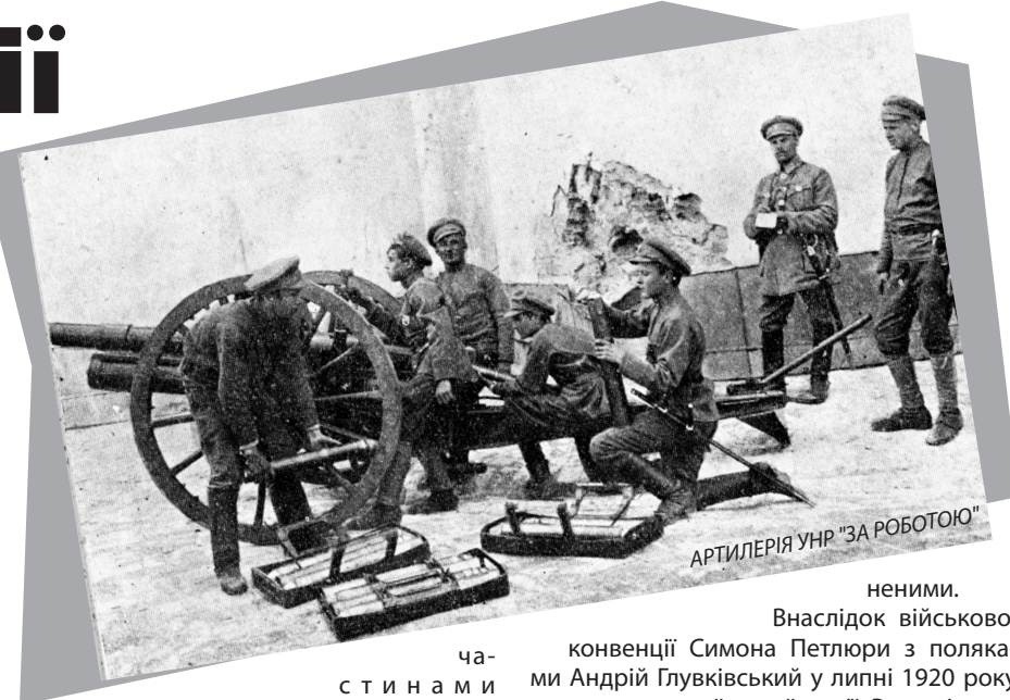
АРТИЛЕРІЯ УНР "ЗА РОБОТОЮ"

1919 року Андрій повернувся до гірничого інституту, але продовжити студії не вдалося, оскільки в серпні його, як колишнього старшину російської армії, було мобілізовано до армії генерала Денікіна. В лютому 1920 року разом із денікінськими