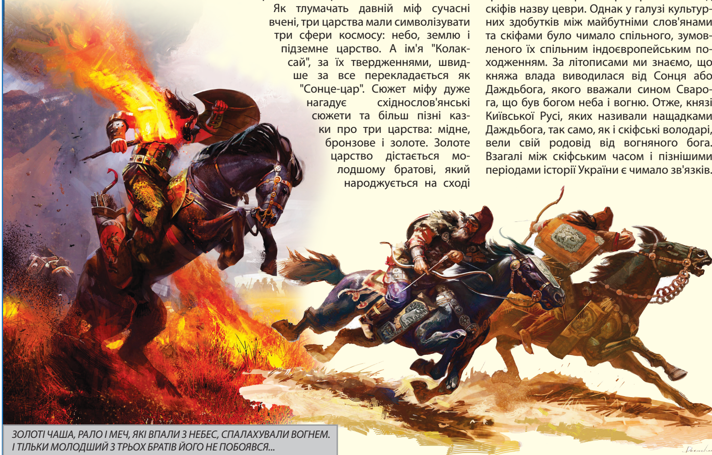
ЗОЛОТІ ЧАША, РАЛО І МЕЧ, ЯКІ ВПАЛИ З НЕБЕС, СПАЛАХУВАЛИ ВОГНЕМ. І ТІЛЬКИ МОЛОДШИЙ З ТРЬОХ БРАТІВ ЙОГО НЕ ПОБОЯВСЯ...

Подібно до інших індоєвропейських народів, творіння землі з космічної порожнечі праслов'яни пов'язували з богом-творцем, імовірно, Дварогом або Стрибогом, який міг бути і втіленням вогню (не випадково Перуна називали "Сварожичем"), і втіленням хаосу, пов'язаного з вітрами. Разом з небесною матір'ю - можливо, Колядою, - він відповідав за відтворення світового устрою.