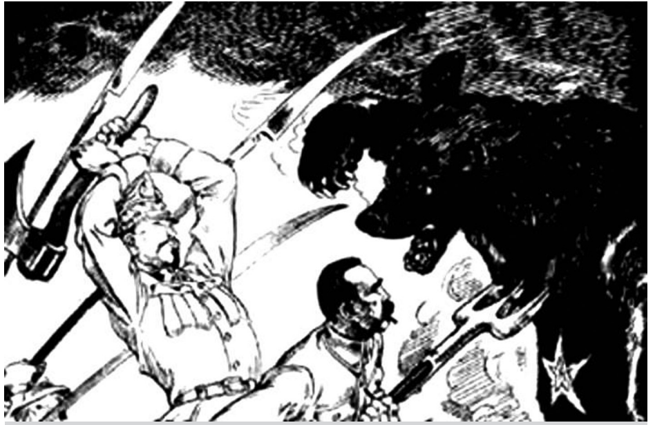
ПЛАКАТ 1920 Р. "ДИВО НА ВІСЛІ". МОСКОВСЬКИЙ БІЛЬШОВИЗМ ЗОБРАЖЕНИЙ У ВИГЛЯДІ ВЕДМЕДЯ, ЛАСОГО ДО "МЕДУ" ПОЛЬСЬКОЇ І УКРАЇНСЬКОЇ ЗЕМЛІ!...