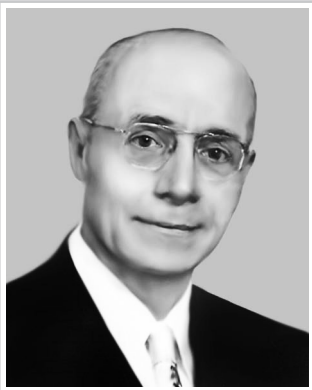
ПРОФЕСОР-ЕНТОМОЛОГ УНІВЕРСИТЕТУ МІННЕСОТИ МИКОЛА ГАЙДАК