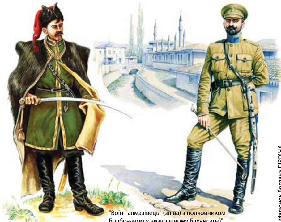
"Воїн-«алмазівець»" (зліва) з полковником Болбочаном у визволеному Бахчисарайі"