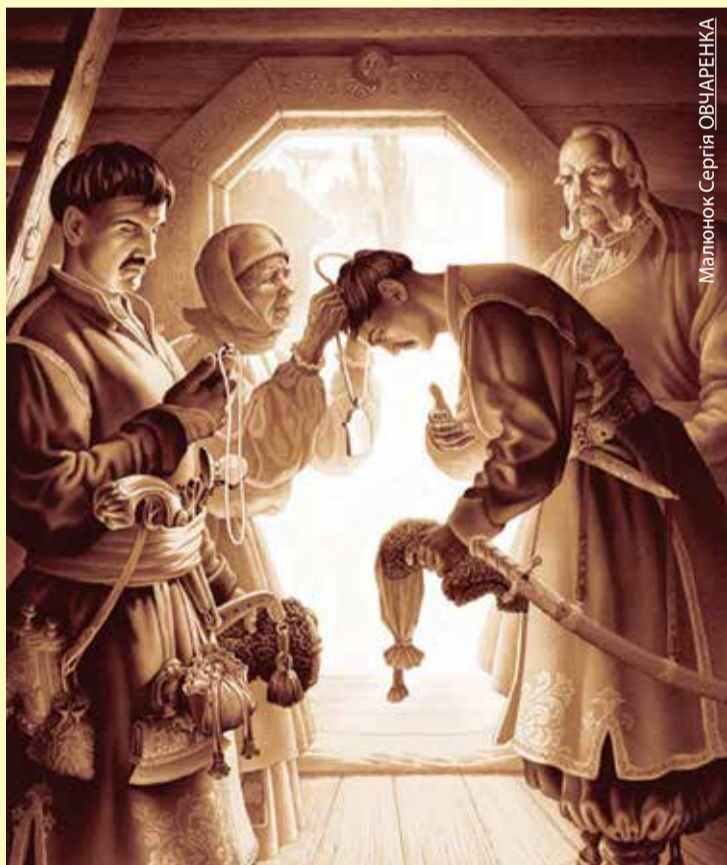
Малюнок Сергія ОВЧАРЕНКА