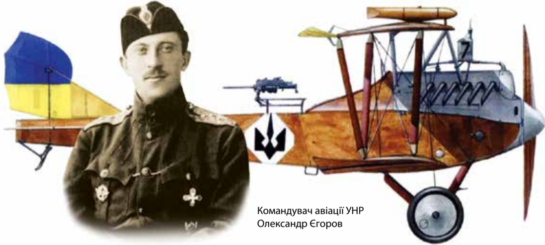
Командувач авіації УНР Олександр Єгоров

Частина бійців брала участь і в Другому зимовому поході і навіть коли «алмазівці» вже були інтерновані до Польщі, під час