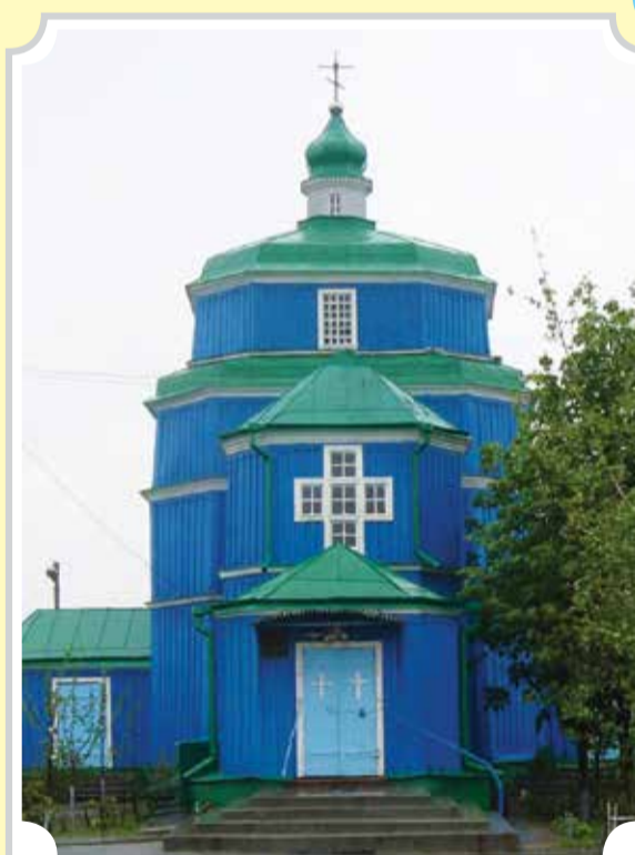
Дерев'яній козацькій церкві у Бериславі – вже майже три століття...

1784 року, вже після руйнації московськими військами останньої Запорозької Січі, козаки розібрали церкву, зроблену з дубового дерева, переправили її Дніпром вниз по течії і сантиметр за сантиметром відновили її у Бериславі. Храм і до сьогодні добре зберігся, не зважаючи на те, що в часи безбожників-більшовиків його закрили і збиралися зни-