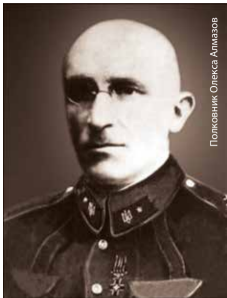
Полковник Олекса Алмазов

Олекса Алмазов був з родини добропорядного, нічим не примітного херсонського чиновника. Олекса виявився здібним у навчанні – і в час навчання у реальному училищі грузинського Тифлісу (Тбілісі), і у військових училищах – спочатку піхотному