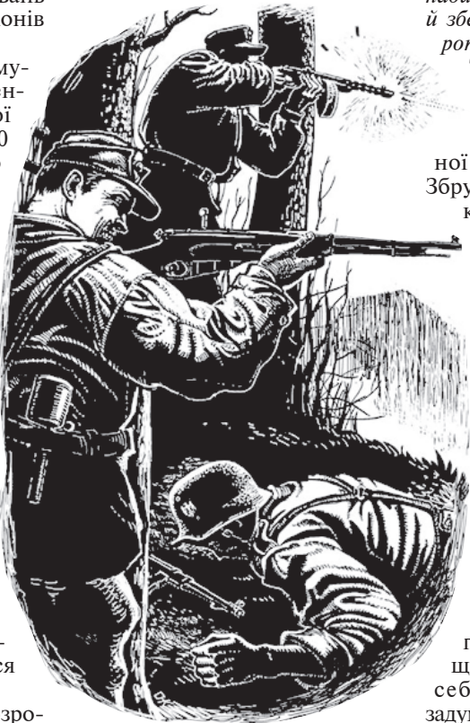
Малюнок Олега КИНАЛІ

ської групи в жовтні 1943-го з Волині на Наддніпрянщину відправлено сотню під командуванням Омеляна Грабця - "Батька".