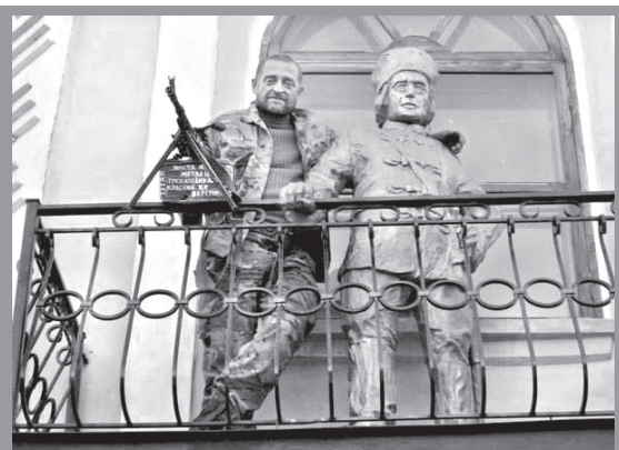
У Старобільську "Німець" сфотографувався на балконі поруч зі своїм "вчителем" - батьком Махном

Несподівано для самого себе в "Айдарі" отримав позивний "Німець". Як тільки худорлявий, високий, рудоволосий нащадок росіян і українців взяв у руки кулемет і перепоясався нахрест кулеметними стрічками, побратими по зброї, які реготали над