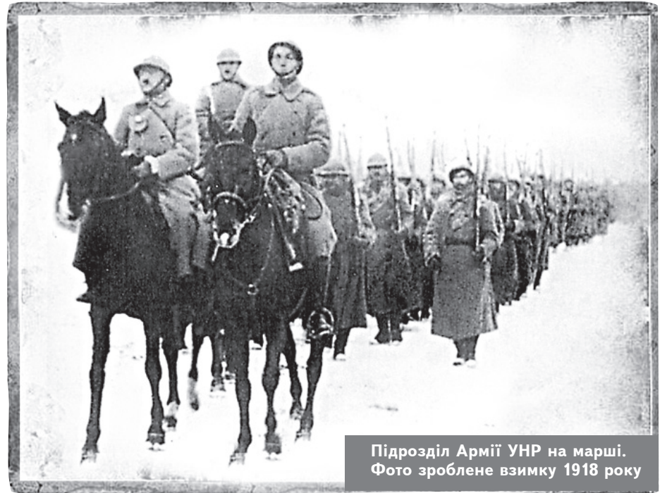
Підрозділ Армії УНР на марші. Фото зроблене взимку 1918 року

й залізний крок" — таким був девіз цього елітного підрозділу. Слава ж непереможної постраждала... через дамську шапочку. Як згадують очевидці, полковник на цілих шість годин затримав відступ дивізії з місцевості, де вона була на дуже невіддільних позиціях перед денікінцями, що наступали. Чому? Через тиждень мав бути Новий рік і місцевий майстер дошивав замовлену для його коханки кокетливу шапочку із білого хутра... Коли ж дивізія зрештою виступила, на похідну колону з усією потужністю вдарила денікінська Кавказька дивізія під командуванням князя Голіцина. Розбита й розпо-