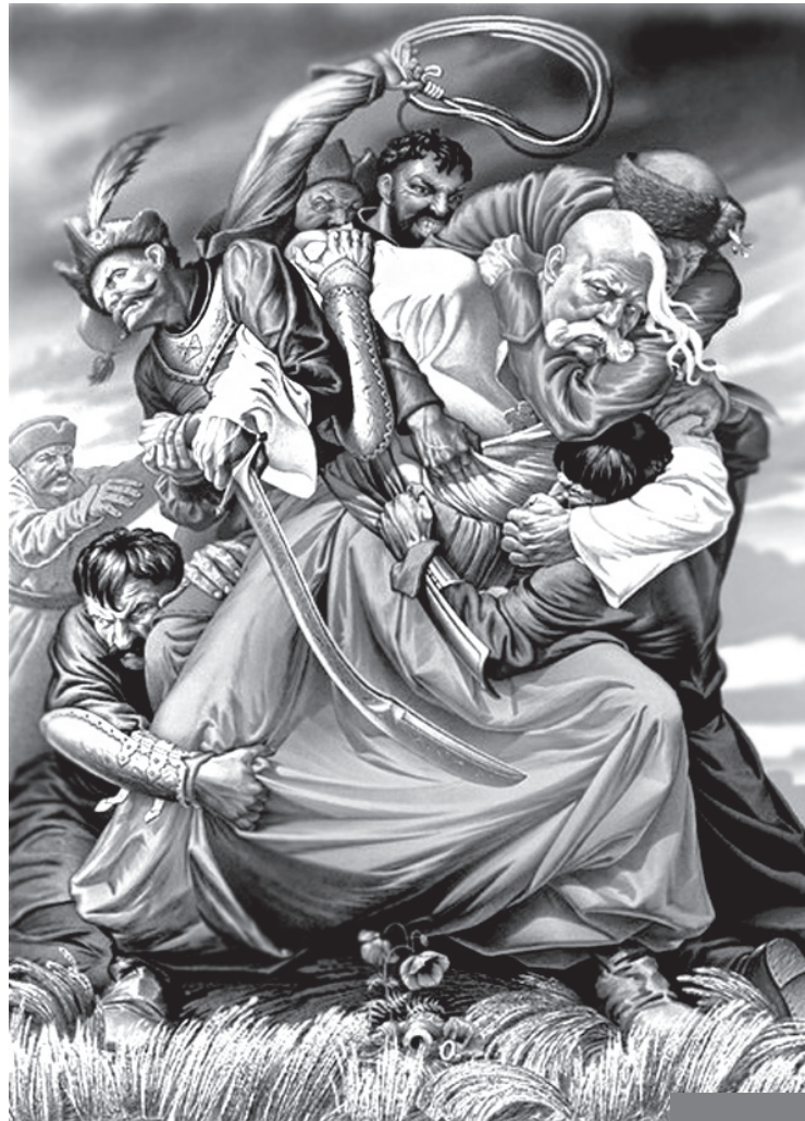
Намагаючись звільнитися з «обіймів» Польщі, козацька Україна після Переяславської ради потрапила у не менш цупкі «обійми» Москви...

6 років (!) Москва не погоджувалася вступити у війну проти Речі Посполитої на боці України, чекала доки сплинуть кров'ю та ослабнуть її сусіди і лише загроза переходу Б.Хмельницького під турецький протекторат змусила її діяти енергійніше і прийняти відповідні рішення Земського собору. Звичайно, Москва була зацікавлена насамперед в ослабленні Речі Посполитою,