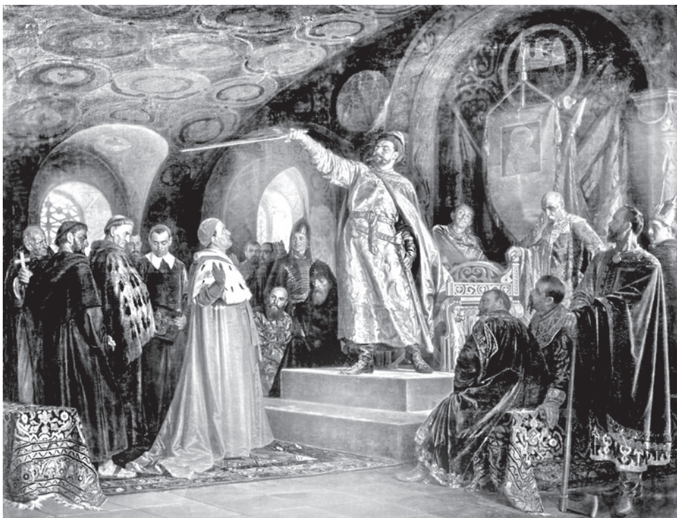
ОДНА З ЛЕГЕНД РОЗПОВІДАЄ, ЩО КОЛИ ДО ПРАВИТЕЛЯ РУСІ З'ЯВИВСЯ ПОСОЛ ПАПИ РИМСЬКОГО І ЗАПРОПОНУВАВ СТАТИ КАТОЛИКОМ ВЗАМІН «УЗАКОНЕННЯ» КОРОЛІВСЬКОГО ТИТУЛУ, РОМАН МСТИСЛАВИЧ ЗМАХНУВ МЕЧЕМ НАД ЙОГО ГОЛОВОЮ І ЗАПРОПОНУВАВ ШВИДКО ЙТИ ГЕТЬ, БО ВІРУ ПРАВОСЛАВНУ МІНЯТИ НЕ ЗБИРАВСЯ... (КАРИНА МИКОЛИ НЕВЕРОВА)

1201 року Роман Мстиславич розпочав боротьбу за Київ, а 1204-го встановив цілковитий контроль над столицею. Водночас він вжив цілу низку заходів, що мали легітимізувати його становище як «цезаря на Руській землі» — зокрема, одружився з візантійською принцесою