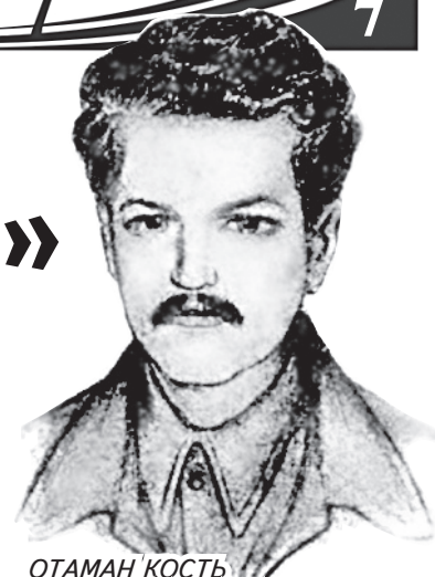
ОТАМАН КОСТЬ СТЕПОВИЙ-БЛАКИТНИЙ ЗАГИНУВ У 23 РОКИ...

дивізію і гайнув на простори, здійнявши антибільшовицьке повстання українців по всій Херсонщині й Катеринославщині. Загинув, потрапивши у засідку чекістів 9 травня 1921