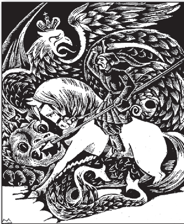
ПЛАКАТ ЧАСІВ ВИЗВОЛЬНОЇ ВІЙНИ — ПРОТИ «БІЛИХ» І «ЧЕРВОНИХ» ЗАЙДІ З РОСІЇ

зію (в різний час вона мала від 12 до 15 тисяч воїнів). На вже окупованій більшовиками території цей величезний підрозділ