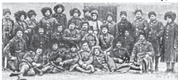
СТАРШИНИ КОНВОЮ КОМАНДАРМА ПІД ЧАС ПЕРШОГО ЗИМОВОГО ПОХОДУ АРМІЇ УНР

6 грудня 1919 р. на військовій нараді у Новій Чорторії було остаточно вирішено здійснити армією УНР партизанський рейд тилами Денікіна. Зимовий похід тилами більшовиків і денікінців став безпрецедентним в історії воєн за своїм характером і героїчністю. В похіді взяло участь близько 10000 осіб. Проте сам бойовий склад частин нараховував 2000 багнетів, 1000 шабель та 14 гармат. 75% загальної кіль-