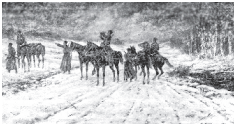
РОЗВІДКА КІННОГО ПОЛКУ ІМЕНІ КОСТЯ ГОРДІЄНКА В ОКОЛИЦІ ТАЛЬНОГО НА ЧЕРКАЩИНІ

Ігор АРТЕМЕНКО — за матеріалами інтернет-видань