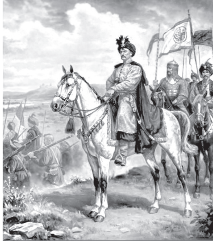
Перемогу Хмельницького під Батогом європейські сучасники порівнювали з перемогою Ганнібала під Каннами...

А після повернення Розанди в Молдову у Калиновського з'явився новий суперник — молодий і амбітний син гетьмана Хмельницького Тиміш. Мартин Калиновський гнівно заявляє,