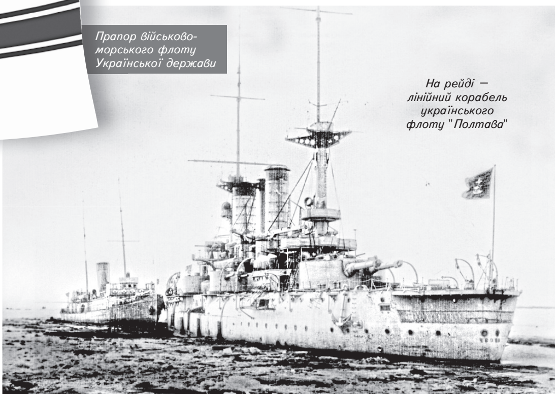
На рейді – лінійний корабель українського флоту "Полтава"