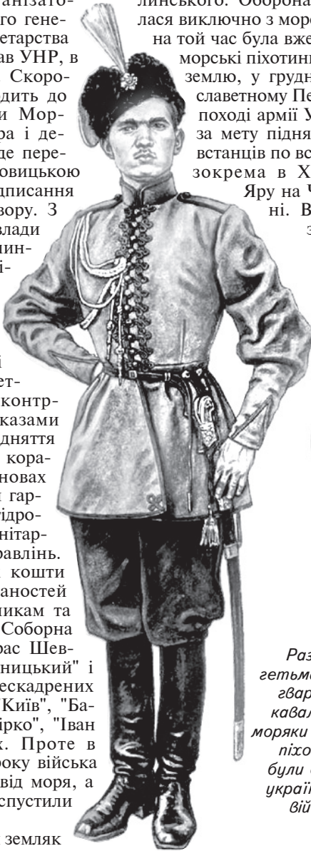
Разом з гетьманською гвардією і кавалерією, моряки і морські піхотинці були елітою українського війська

Другий Зимовий похід армії УНР 1921 року став для нього останнім. У знаменитому бою під Базаром контр-адмірал загинув, а разом з ним – і сподівання на майбутнє українського флоту. Морські піхотинці до останнього билися проти кавалеристів Котовського, понад 400 з них полягло в бою, ще 359 були розстріляні