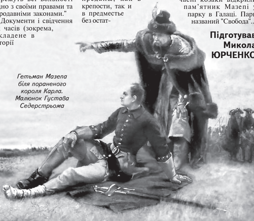
Гетьман Мазепа біля пораненого короля Карла. Малюнок Густава Седерстрьома